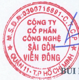
BUI NAM LONG